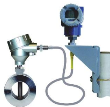
Рисунок 2 - Расходомер вихревой 84CW (версия для отдельного монтажа)

Архангельск (8182)63-90-72 Астана (7172)727-132 Астрахань (8512)99-46-04 Барнаул (3852)73-04-60 Белгород (4722)40-23-64 Брянск (4832)59-03-52 Владивосток (423)249-28-31 Волгоград (844)278-03-48 Вологда (8172)26-41-59 Воронеж (473)204-51-73 Екатеринбург (343)384-55-89 Иваново (4932)77-34-06