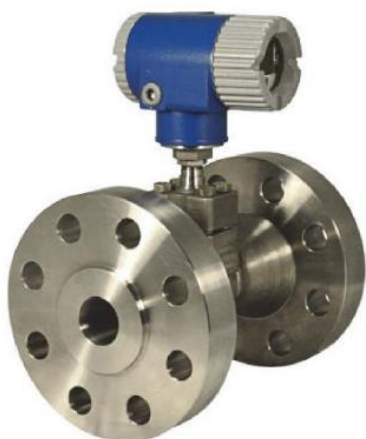
Рисунок 3 - Расходомер вихревой 84CF