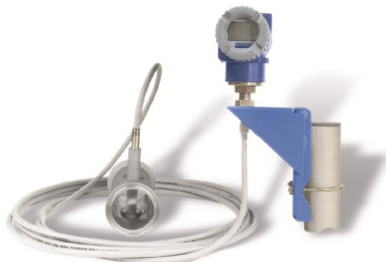
Рисунок 4 - Расходомер вихревой 84S (версия для раздельного монтажа)